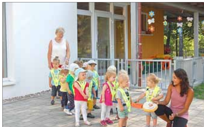
Mit freundlichen Grüßen Das Kindertagesstätten-Team „Pffifikus“