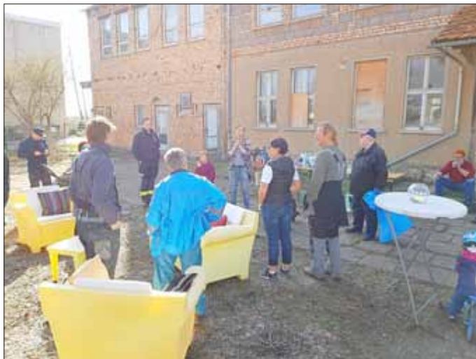
Viele fleißige Helfer fanden sich 2019 zum Sammeln von Unrat und Müll.