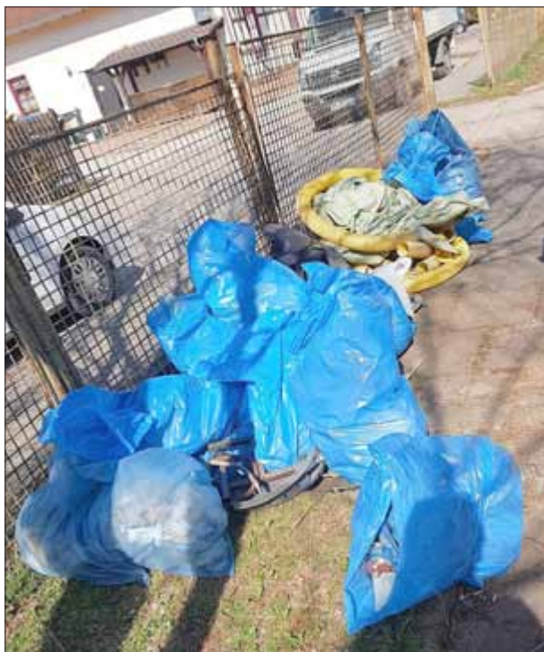
Eine große Menge Müll wurde wieder eingesammelt und vom Bauhof abtransportiert.

Nach Abschluss der Sammelaktion fanden sich alle noch zu einem kleinen gemütlichen Ausklang an der alten Schule zusammen um sich mit Kaffee und Kuchen oder Bratwurst zu stärken. Ein großes Dankeschön gilt allen Helfern, den Unterstützern und Sponsoren für Speisen und Getränke, der Organisatorin und natürlich dem Bauhof der Gemeinde. Somit ist die Umgebung von Holzhausen für Ostern und die Saison gerüstet.