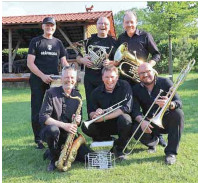
Sieger 2018 „BlasSociety“ aus Gräfenroda

Hop, wichtig ist nur: „Es geht um die Wurst!“. Im vergangenen Jahr konnten die „BlasSociety“ aus Gräfenroda die Zuschauer und die Jury überzeugen.