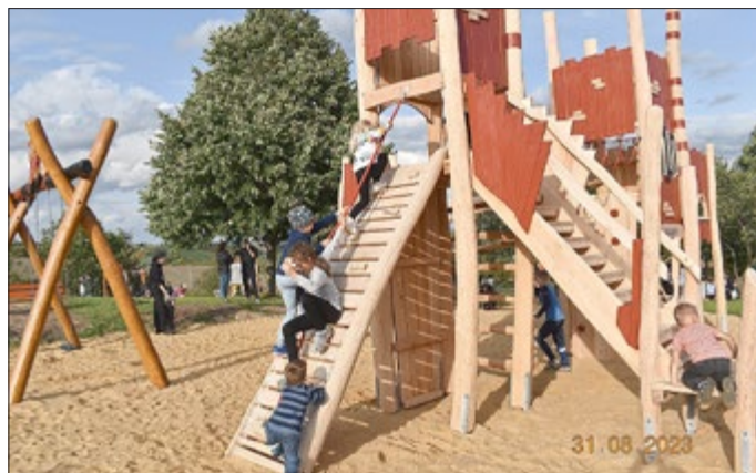
Am Kletterturm macht es richtig Spaß.

Die Eröffnung des Spielplatzes und Fitnessparcours markiert einen bedeutenden Schritt in Richtung eines aktiven und gesunden Lebens in Holzhausen und zeigt, wie eine Gemeinschaft durch Zusammenarbeit und Engagement wachsen und gedeihen kann. Wir sind gespannt auf die Abenteuer und Herausforderungen, die diese neuen Einrichtungen für uns bereithalten, und freuen uns auf viele fröhliche Momente in ihrem Schatten.