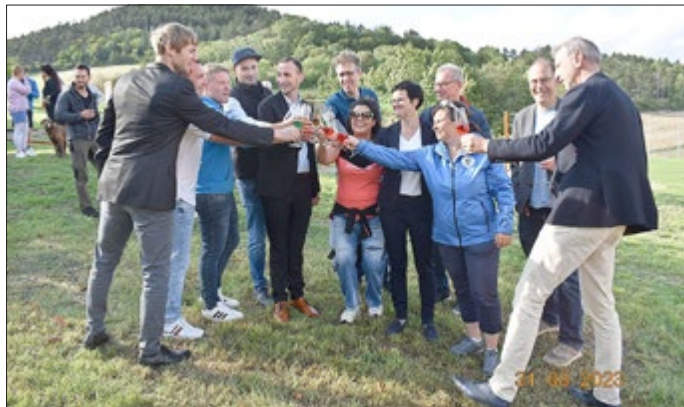
Viele Gäste waren bei der Eröffnungsfeier der Spiel- und Fitnessarena dabei.