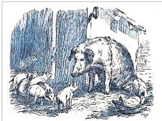
Das Team der Bibliothek